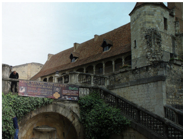
Affiches annonçant la première mondiale de l'exposition William Blake en 2014

De novembre 2014 à fin janvier 2015, une seconde exposition a été proposée au public, à Barbaste (Sud-Ouest, France), consacrée à l'artiste Alphonse Legros. Quarante-deux œuvres originales ont été présentées : dessins, gravures, aquarelles, peintures montrant l'étendue du savoir faire de ce grand artiste. Là encore, des élèves de tous âges et horizons ont eu l'occasion de découvrir cette exposition dont certaines œuvres ont été amenées sur place, dans les locaux scolaires, par des membres de l'association toujours soucieux de respecter l'objectif intangible de la transmission au plus grand nombre.