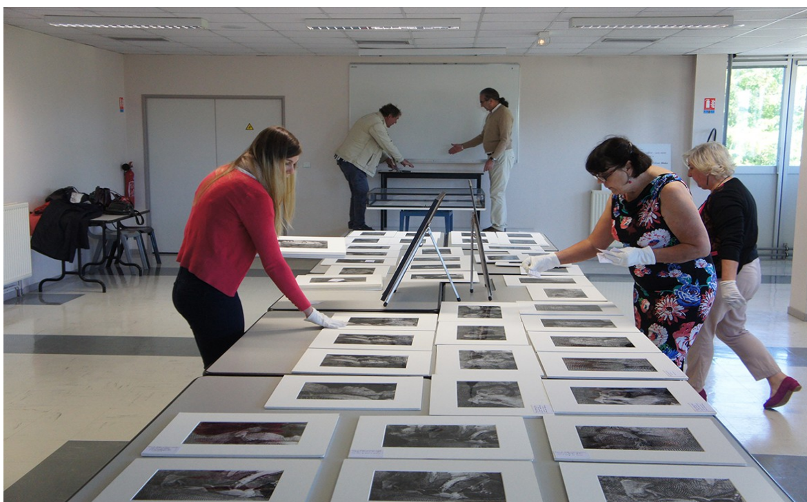
Présentation William Blake au lycée de Nérac 2014 / 2015

Son parcours professionnel peut être défini comme historien de l'art indépendant et autodidacte.