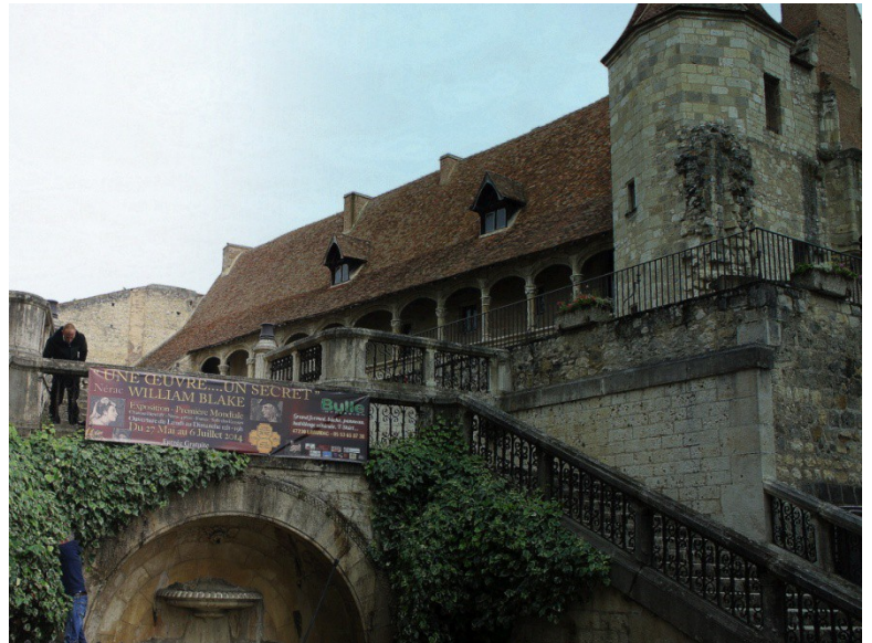
Affiches annonçant la première mondiale de l'exposition William Blake en 2014