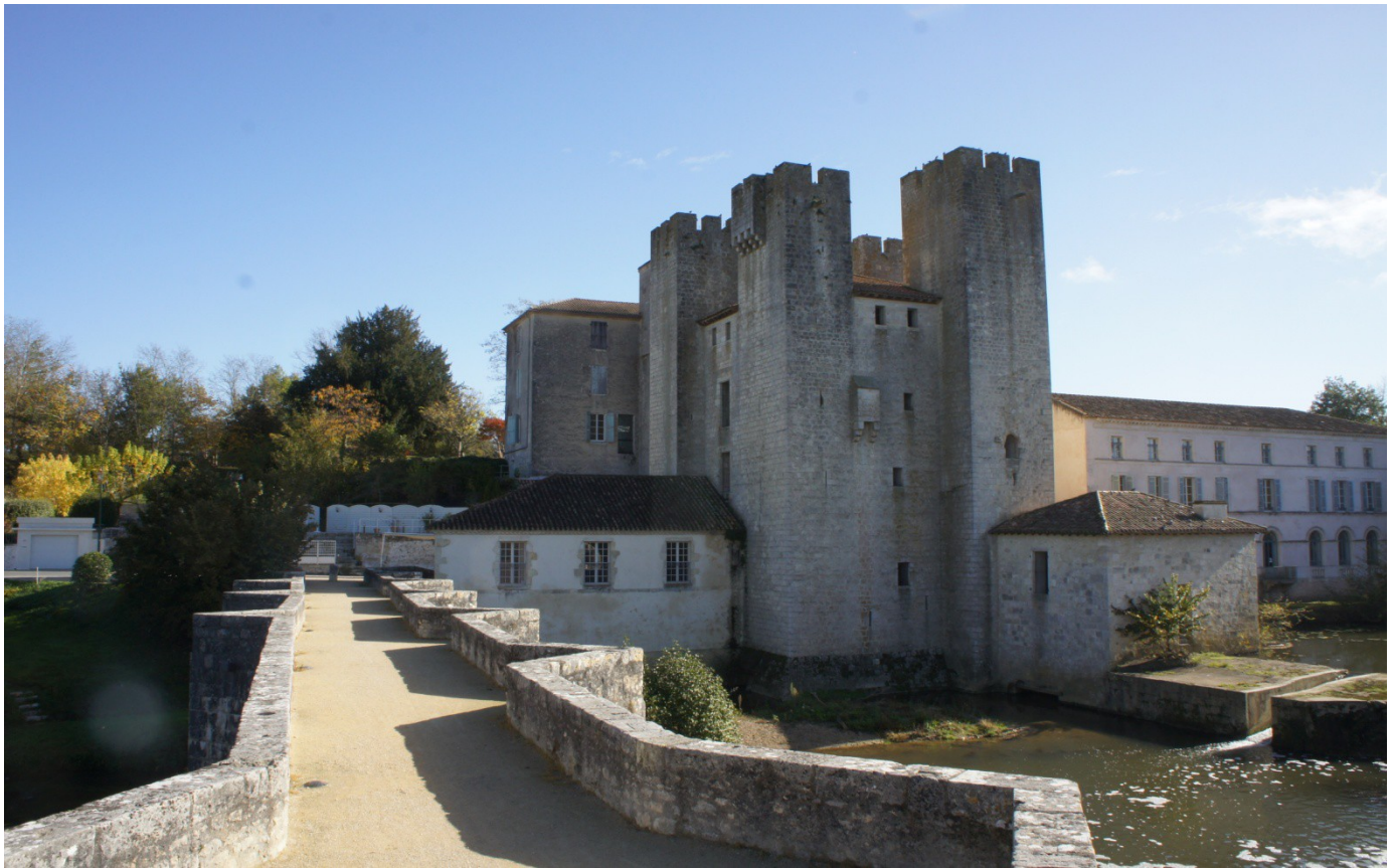
Le moulin de Barbaste, lieu de l'exposition des œuvres d'Alphonse Legros

En décembre 2015 l'association, poursuivant sa politique d'ouverture vers le jeune public, a invité les élèves des écoles élémentaires et des collèges de Lavardac et de Mézin à découvrir un livre rare, une édition originale du conte de Noël de Charles Dickens « A Christmas Carol » avec son coffret. A cette occasion des animations et diverses activités ont été proposées par les bibliothèques de ces deux cités.