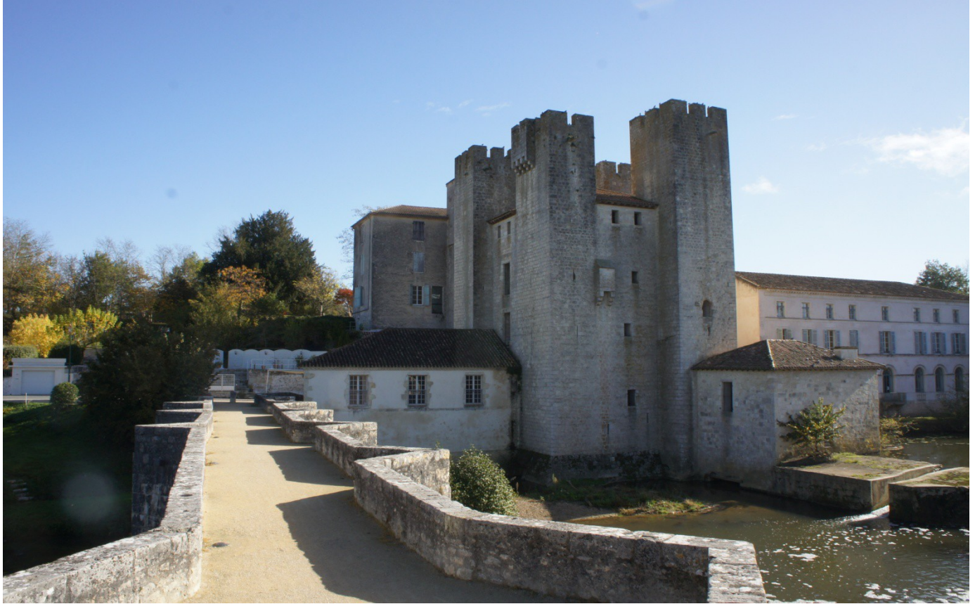
Le moulin de Barbaste, lieu de l'exposition des œuvres d'Alphonse Legros